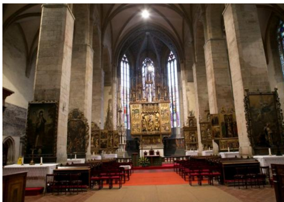
Kościół św. Jakuba

Dom Thurzonów – należał do lewockiego rodu bankierów i kupców (obecnie archiwum państwowe). Okazały Dom Hauna z renesansowymi portalami i freskami (działało tu w XIX w liceum ewangelickie). Klasycystyczny Żupny Dom – siedziba kasztelani spiskiej – w dalszym ciągu służy celom administracyjnym. W południowej części rynku wzniesiono w połowie XIX wieku klasycystyczny kościół ewangelicki.