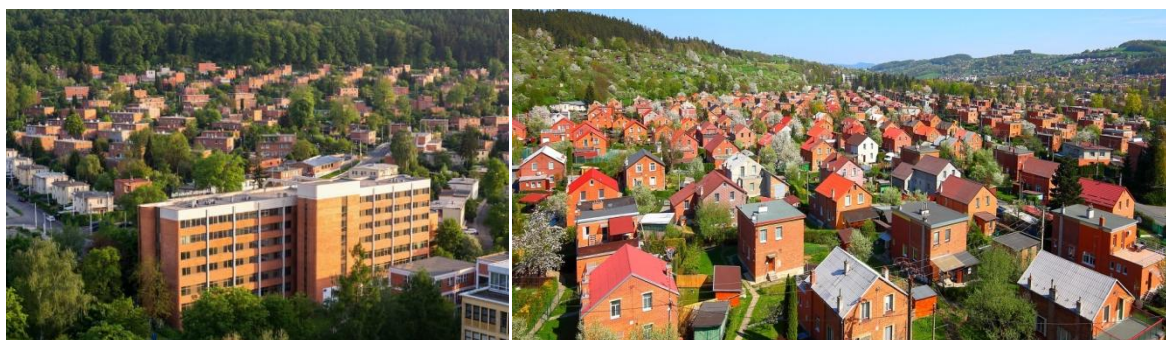
Zlin-dawna fabryka buwia i osiedle pracowników Baťy

Liczący ok. 80 tys. mieszkańców Zlín stał się metropolią południowo-wschodnich Moraw nie tylko dzięki swojemu położeniu. W pierwszej połowie XX w. miasto stało się sławne dzięki założycielowi fabryki obuwia, którym był Tomáš Baťa. Miejscowa funkcjonalistyczna architektura której pomysłodawcą był Bata jest wyjątkowa w skali kraju i całego świata. Centrum miasta z terenem fabrycznym i dzielnicami mieszkalnymi, które wybudowano w czasach największej koniunktury firmy Baťa, są strefą zabytkową. W 2001 r. w Zlinie założono Uniwersytet im. Tomáša Baťy. W mieście ma swoją siedzibę wiele ważnych urzędów czy instytucji kulturalnych, odbywają się ważne kongresy, przede wszystkim z dziedziny medycyny. W 1894 r, gdy 18-letni Tomasz otwierał swój skromny zakład, żyło w Zlinie nieco ponad 2 tysiące obywateli. Czterdzieści lat potem było ich już czterdzieści tysięcy, a Zlín stał się jednym z najszybciej rozwijających się miast w Europie.