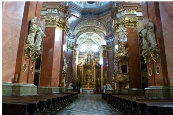
Kości6ł św. Mikołaja – wni6trze