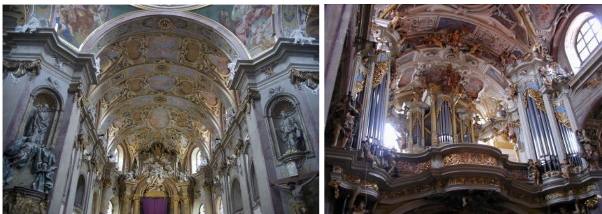
Wnętrze bazyliki; sklepienie i prospekt organowy

Wnętrze ozdobione jest barokowymi stiukami, które wykonali włoscy sztukatorzy. Na sklepieniach prezbiterium i kopule są piękne freski. Duże wrażenie robi fasada kościoła. Ma prawie 100 metrów długości. Attyka ozdobiona jest czternastoma rzeźbami wykonanymi z piaskowca. Są to postacie 12 apostołów oraz św. Sebastiana i św. Rocha – patronów od „zarazy”.