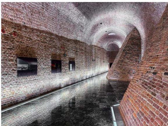
Bastion Św. Barbary