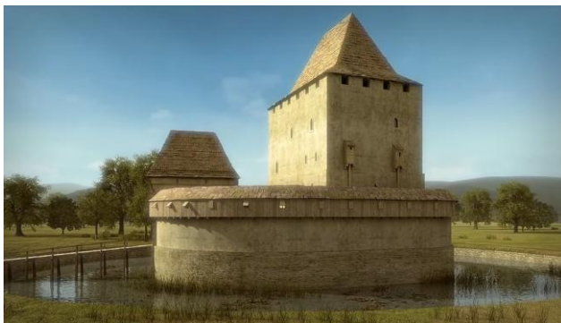
Tak wygląda dzisiaj a tak prawdopodobnie wyglądała w 1314 roku