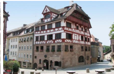
Dom Albrechta Durera