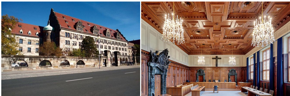
Pałac Sprawiedliwości i słynna sala Procesów Norymberskich

w 1946 roku norymberski Pałac Sprawiedliwości, mimo widocznych skutków bombardowań, był jednym z lepiej zachowanych gmachów w mieście. We wrześniu część jego pomieszczeń, pod nadzorem amerykańskich saperów, została wyremontowana przez jeńców z SS. W Norymberdze wciąż jednak brakowało ogrzewania.