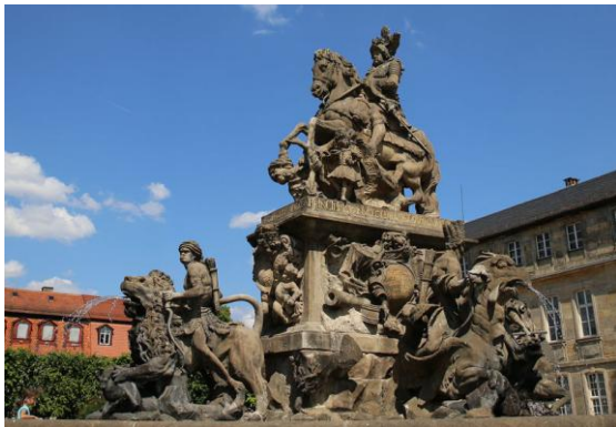
Jedna z fontann miejskich

Jednym z najbardziej znanych mieszkańców Bayreuth był ceniony niemiecki kompozytor Richard Wagner, uważany dzisiaj za jeden z symboli miasta. Wagner zamieszkał tutaj wraz z rodziną w rezydencji w której obecnie znajduje się muzeum poświęcone jego pamięci. Na tyłach budynku znajduje się grób kompozytora. Bayreuth znane jest z festiwalu wagnerowskiego który do dzisiaj odbywa się w budynku Teatru Festiwalowego. Przy jego projektowaniu osobiście brał udział sam kompozytor ponieważ zależało mu na stworzeniu idealnej sceny i akustyki dla swoich sztuk.