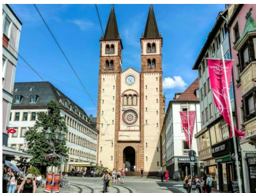
Katedra św. Kiliana

Uchodzi za najważniejszy kościół Würzburga - romańska katedra z XI wieku, z licznymi cennymi dziełami sztuki . Na szczególną uwagę zasługuje barokowa kaplica boczna, znana jako Schönbornkapelle. Obszar na którym wznosi się wuirzburska katedra od wczesnego średniowiecza był najważniejszą częścią miasta po wschodniej stronie Menu. To właśnie w tej okolicy pierwszy biskup Wurzburga Burchard odnalazł szczątki trzech frankońskich męczenników – sw. Kiliana, sw. Totnana, i sw. Kolonata którzy zostali zgładzeni na terenie dzisiejszego Wurzburga w 689 roku. Już w połowie VIII wieku rozpoczęła się budowa drewnianej katedry. W tym kształcie przetrwała prawie 70 lat po czym całkowicie spłonęła. Budowa nowej katedry trwała prawie dwa stulecia. W kolejnych wiekach była wielokrotnie przebudowywana. Ostatni raz na przełomie XVII/XVIII wieku w stylu barokowym. W czasie nalotów II wojny światowej znacznie ucierpiała a jej odbudowa trwała 22 lata. Z zewnątrz nadano jej styl romański a wewnątrz jest już nowoczesne i trudno uwierzyć że świątynia ma niemal tysiąc lat.