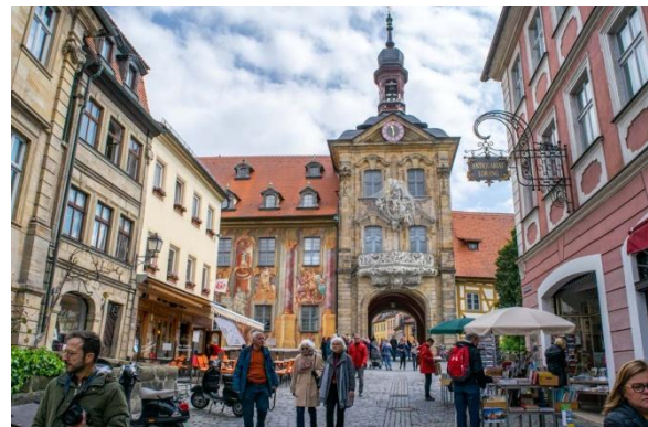
Brama Starego Ratusza