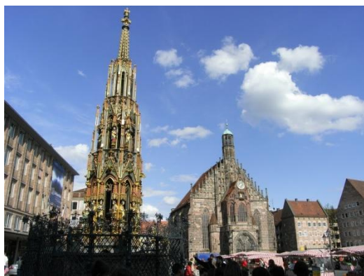
Hauptmarkt, Frauenkirche i Piękna Fontanna

halowy gotycki kościół powstał z fundacji cesarza Karola IV w połowie XIV w. Projektował go Piotr Parler, ten sam wg którego pomysłu powstała katedra św. Wita w Pradze. Początkowo zamierzano przechowywać tu insygnia Rzeszy, jednak ostatecznie władca przeniósł je w bezpieczniejsze miejsce, do słynnego zamku Karlstejn pod Pragą. Na środku frontowej ściany znajduje się wykusz z zegarem z 1509 roku z pochodem figurek elektorów oddających hołd cesarzowi Karolowi IV codziennie o godz. 12. Wewnątrz świątyni – najcenniejszy Tucher Altar (1445 r) - gotycki ołtarz przedstawiający Ukrzyżowanie.