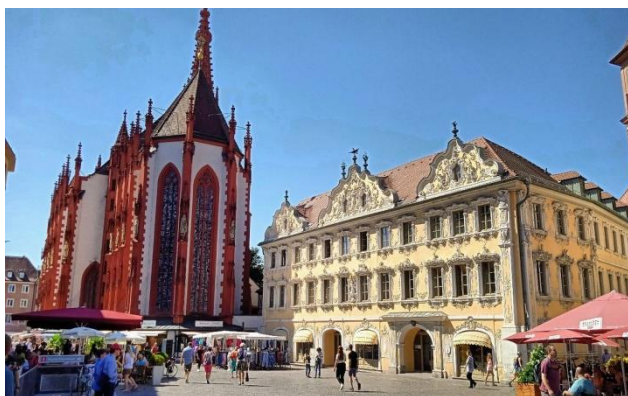
Rynek –Dom Jastrzębia i kaplica św. Marii