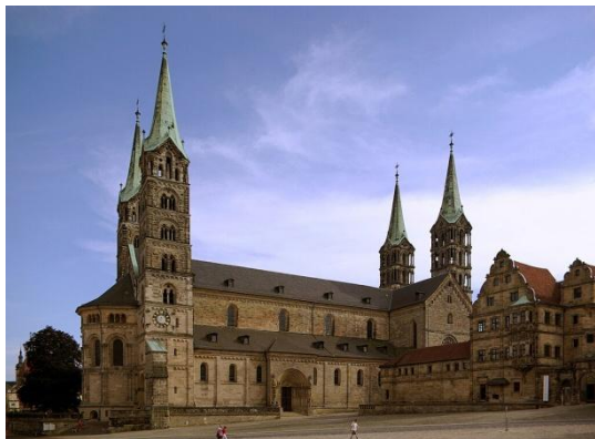
Archikatedra Bamberger Dom

Najważniejsza bamsberska świątynia która powstała w tym miejscu już na początku XI wieku a jej fundatorami byli cesarz Henryk II Święty wraz z żoną Kunegundą, którzy założyli w mieście biskupstwo. Dzisiejsza romańsko-gotycka budowla z czterema wysokimi na ponad 80 metrów wieżami powstała w XIII wieku.