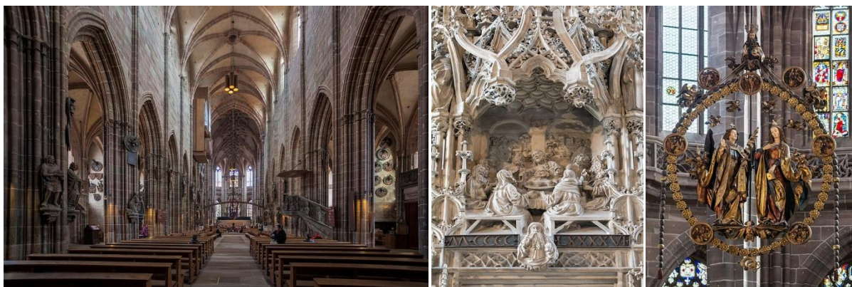
Wnętrze kościoła, fragment Sakramentarium, Pozdrowienie Anielskie