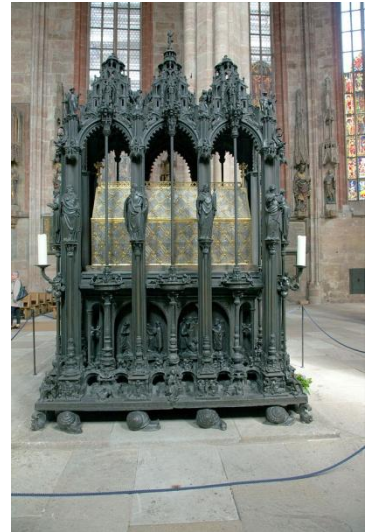
Kościół św. Sebald – wnętrze , grobowiec świętego Sebald w prezbiterium