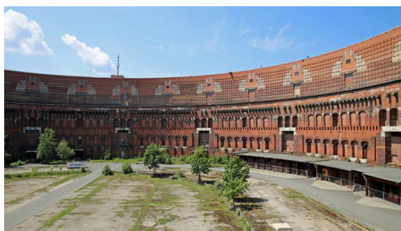
„Hala Kongresowa”-teren zjazdów NSDAP

Już w pierwszym dniu spotkamy się z licencjonowaną przewodniczką z Norymbergi i zwiedzanie rozpoczniemy objazdem autokarowym terenów zjazdów partyjnych, nazistowskich parad i pozostałości po monumentalnych budowlach które obrazują historię Norymbergi jako miasta propagandy hitlerowskiej. Frankonia uchodziła za największą twierdzę nazistów a Norymberga stała się jednym z symboli nazistowskich Niemiec.