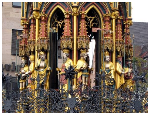
Fragment Pięknej Fontanny