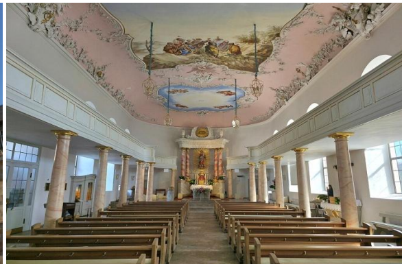
Wnętrze kościoła Zamkowego

Miejscowy rynek otoczony jest kamienicami z bogatymi fasadami. Na placu stoi kilka fontann. W odróżnieniu do innych bawarskich miast dominuje tu zabudowa kamienna, z piaskowca. Nie ma zbyt wiele budynków z muru pruskiego.