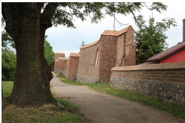
Zachowane mury obronne

Ponad 40% powierzchni Koszalina zajmują lasy oraz parki – w samym centrum miasta znajdują się aż cztery. Najpopularniejszym z nich i uważanym także za najpiękniejszy jest Park Książąt Pomorskich . Jego obszar to 10 hektarów. Warto podkreślić, że park powstawał w latach 1602-1816, a jego zagospodarowanie zakończyło się około 1934 roku. To właśnie Koszalin może pochwalić się największym w Polsce zadaszonym amfiteatrem – na widowni Amfiteatru im. Ignacego Jana Paderewskiego jest aż 4,5 tys. miejsc dla widzów. W mieście działają także m.in. Filharmonia Koszalińska oraz Bałtycki Teatr Dramatyczny im. Juliusza Słowackiego. Co roku w Koszalinie odbywa się wiele ciekawych wydarzeń kulturalnych, które przyciągają widzów z całego kraju. Są to m.in. najstarszy i największy w Polsce festiwal młodego kina - Koszaliński Festiwal Debiutów Filmowych „Młodzi i Film”, Europejski Festiwal Filmowy Integracja Ty i Ja, Festiwal Kabaretu w Koszalinie oraz Hanza Jazz Festiwal. Położony przy Rynku Staromiejskim modernistyczny Ratusz ma tyle samo przeciwników co zwolenników. Wybudowany w latach 60. budynek wyróżnia się dość charakterystyczną bryłą i zdecydowanie można uznać go za symbol Koszalina. Co ciekawe, podobno wedle pierwszych założeń taki ratusz miał stanąć w Szczecinie.