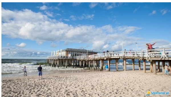
Zejsie nr 7

jeszcze taras o powierzchni 400 m 2 , na którym funkcjonuje mała smażalnia ryb. Co najważniejsze - wejście na molo jest bezpłatne. Poza tym, na spacer można wybrać jeszcze dwa inne mola o długości ok. 100 m każde.