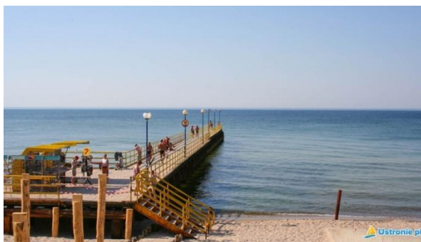
Zejsie Nr 8