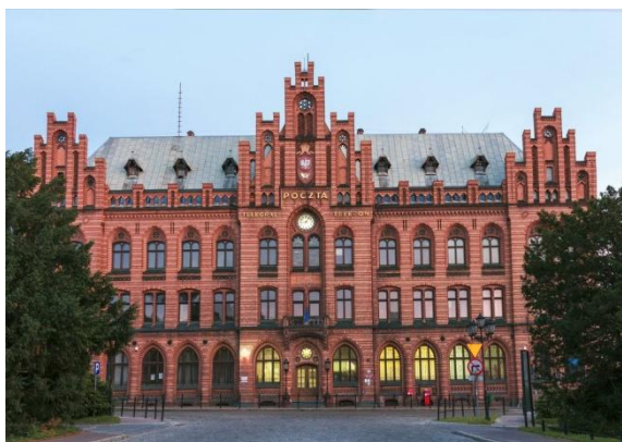
Neogotycki budynek Poczty Polskiej

Historia miasta sięga wieków średniowiecznych. W roku 1266 Koszalin uzyskał prawa miejskie na prawie lubeckim. Spacer z przewodnikiem staromiejską trasą turystyczną pozwala nam poznać najważniejsze zabytki miasta i jego historię. Podczas spaceru zobaczymy zachowane średniowieczne mury obronne – pierwotnie o obwodzie 1600 m, umocnione były 46 czatowniami i 3 bramami, tworzyły zamknięty pierścień. Grubość muru z podstawy wynosiła 1,30 m, a wysokość sięgała 7 m.