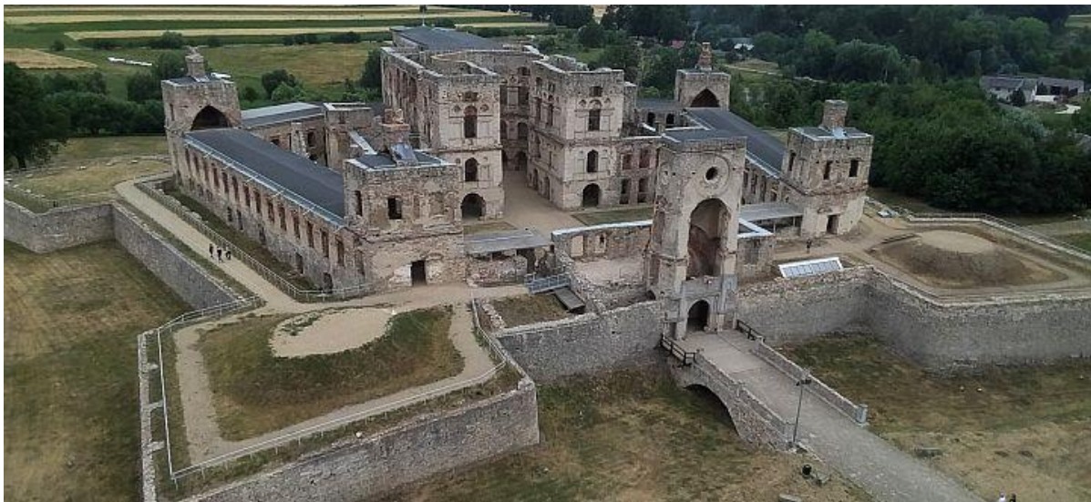
Ruiny zamku Krzyżtopór

Obszerny zamek w stylu włoskim wzniesiony przez Krzysztofa Opalińskiego w XVII wieku jako dzieło jego życia. Wzbogaciwszy się na dostawach wojennych postanowił wybudować siedzibę która przewyższałaby pod każdym względem wszystkie inne budowle ówczesnych magnatów. Zamek był największym tego typu w Europie zanim powstał pałac w Wersalu. Został zniszczony w XVIII wieku i od tamtej pory pozostaje w stanie przepięknej ruiny. Żaden z kolejnych właścicieli nie miał ani woli ani środków na odbudowę tej znakomitej rezydencji.