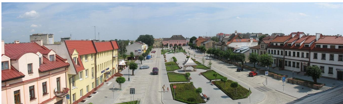
Rynek w Opatowie

OPATÓW - istnieją przesłanki że w Opatowie znajdowała się pierwsza polska komandoria templariuszy założona za czasów Henryka Sandomierskiego w XII wieku. Pozostałością klasztoru templariuszy ma być rzekomo kolegiata św. Marcina. W XIII wieku Opatów i okoliczne ziemie przeszły na własność biskupów lubuskich , którzy dokonali lokacji miasta. W 1514 r. dobra opatowskie kupił kanclerz wielki koronny Krzysztof Szydłowiecki. W tym czasie miasto zostało ufortyfikowane - był to jego szczytowy okres rozwoju . Po śmierci Szydłowieckiego miasto przeszło na własność kolejnych znakomitych rodów polskich, pozostając do 1864 r miastem prywatnym.