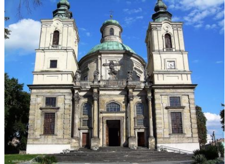
Klimontów – kolegiata