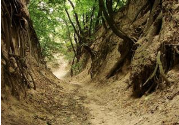
Wąwóz św. Jadwigi

Rejs statkiem po Wiśle - podczas rejsu będziemy podziwiać wspaniałą panoramę Sandomierza, miasta położonego na wysokiej skarpie nad Wisłą.