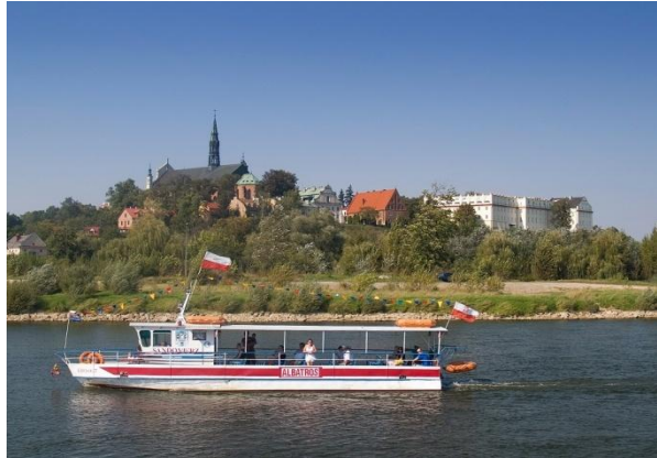
Rejs statkiem po Wiśle

W trakcie zwiedzania Sandomierza zrobimy przerwę na kawę i małą przekąskę.