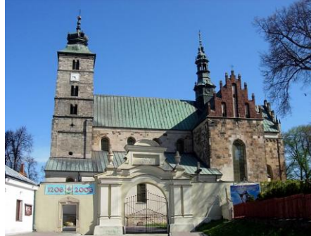
Kolegiata św. Marcina