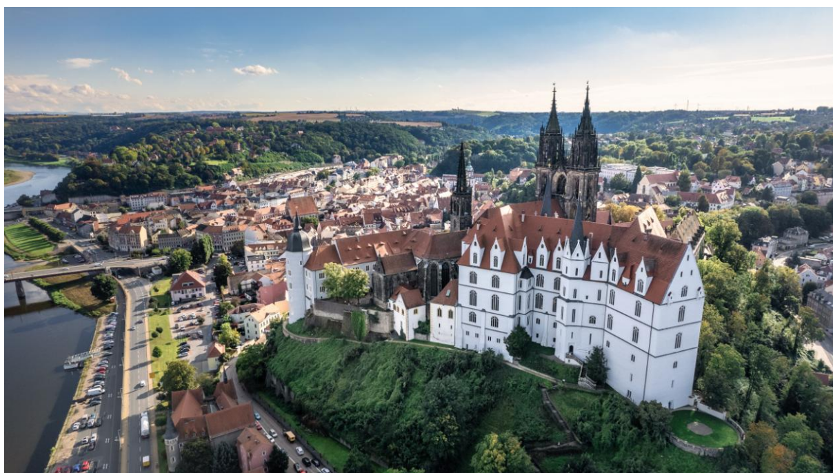
Zamek i katedra

Najstarsza uliczka Starówki dziś nazywa się Burgstrasse (Zamkowa). Jej przebieg nie zmienił się od XII wieku, kiedy to powstała jako wyłożona drewnem droga wiodąca do bramy zamkowej. Około 3 m pod obecnym brukiem znajdują się jeszcze pozostałości tamtego drewna.