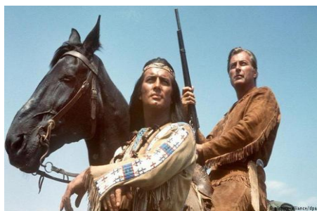
Actorzy grający w Winnetou

Karol May jest jednym z najbardziej poczytnych niemieckich pisarzy. Jego twórczość obejmuje około 100 tomów książek . Najbardziej znanymi tytułami są "Winnetou", "Skarb w Srebrnym Jeziorze" oraz "Przez pustynię". Nakład dzieł Karola Maya wynosi ponad 200 milionów egzemplarzy, połowa z nich to tłumaczenia na ok. 40 języków. Począwszy od 1910 r. aż do II wojny światowej Karol May był niezwykle popularny w Polsce. Postacie z jego powieści stały się ogólnie znanymi idolami młodzieży. We wczesnych latach powojennych opublikowano w Polsce tylko „Winnetou”, „Old Surehand”, „Skarb w Srebrnym Jeziorze” oraz „W Kordylierach”. Dopiero w latach 80. i 90. wydano większość jego utworów. Na motywach jego powieści stworzono cykl filmów o przygodach wodza Apaczów Winnetou, które fascynowały również polskich widzów