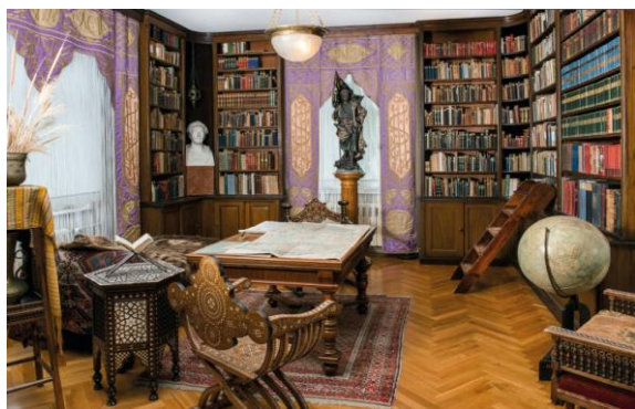
Biblioteka Karla Maya

Muzeum mieści się w historycznym miejscu pracy tego najbardziej poczytnego niemieckiego pisarza przygodowego – w jego byłym domu - w Willi "Shatterhand." Prezentacja ponad 800 obiektów etnograficznych dostarcza informacji o kręgach kulturowych Indian Ameryki Północnej i uznawana jest za jeden z najbardziej wartościowych zbiorów tego typu w Europie.