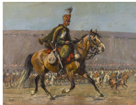
Fragmety Panoramy Siedmiogrodzkiej będące w posiadaniu Muzeum w Tarnowie

Mimo zachwyty jaki obraz wzbudził w Budapeszcie, z niewiadomych przyczyn powrócił do Polski. W roku 1907 dzieło było eksponowane w Warszawie, ciesząc się dalej powodzeniem. Ostatnie wiadomości na temat Panoramy pochodzą z lutego 1908 r., kiedy na łamach pisma „Scena i sztuka” zachwycono się jej artyzmem. Niestety, dzieło nie przetrwało do naszych czasów. Po zakończeniu wystaw w Budapeszcie i we Lwowie ogromne płótno trudno było utrzymać, było to zbyt kosztowne. Zostało pocięte na kawałki żeby łatwiej było je sprzedawać aby odzyskać zainwestowane pieniądze. Wszystko uległo rozproszeniu, część