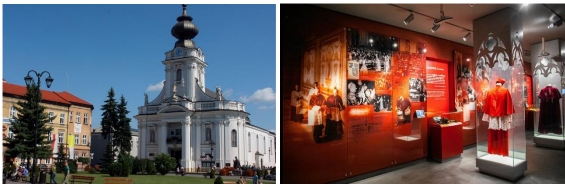
Bazylika i ekspozycja w muzeum Dom Rodzinny Jana Pawła II

Miasto narodzin, dzieciństwa i wczesnej młodości Karola Wojtyły. Przyszły papież spędził tutaj pierwszych 18 lat swojego życia. Podczas spaceru z przewodnikiem zobaczymy najważniejsze obiekty które miały ścisły związek z papieżem- szkoła powszechna, gimnazjum, cukiernia. Zwiedzimy Muzeum – Dom Rodzinny Jana Pawła II. Następnie zawitamy do Bazyliki ONMP – poznamy historię świątyni, miejsca i pamiątki związane z Karolem Wojtyłą (cudowny obraz Matki Bożej, chrzcielnica, polichromie, kaplica Jan Pawła II, relikwia, tron, pamiątki po Benedykcie XVI, zegar słoneczny). Oczywiście będzie przerwa na kawę i słynne kremówki papieskie.