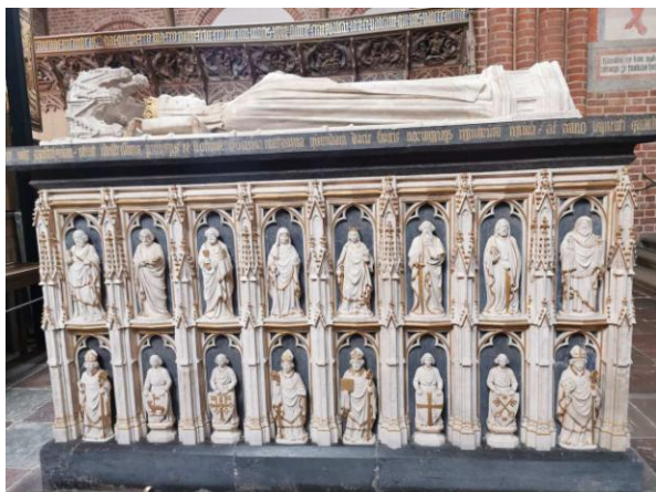
Sarkofag Małgorzaty I

królewskim katedra odzwierciedla zmieniającą się historię architektury europejskiej na przestrzeni 800 lat. Jest to również jeden z najstarszych kościołów ceglanych w Europie Północnej i jeden z pierwszych kościołów murowanych na całym świecie. Wewnątrz świątyni na uwagę zasługuje sarkofag Małgorzaty I. To była najpotężniejsza królowa panująca nad całą Skandynawią – była władczynią Danii, Norwegii i Szwecji. Na sarkofagu znajduje się figura śpiącej królowej przedstawionej jako młoda kobieta – a zmarła w wieku 59 lat. Oprócz licznych ozdobnych królewskich grobowców zobaczymy tutaj freski z XV wieku, odtworzone klasyczne duńskie organy z XVII wieku, czy bogato zdobiony ołtarz główny.