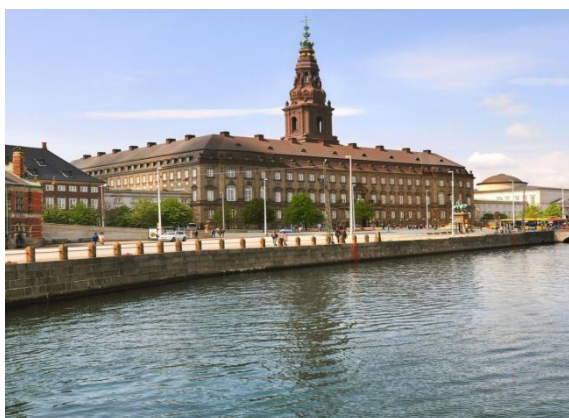
Christianborg – parlament

Christiansborg – dawny zamek królewski i do 1794 r. siedziba królów Danii w Kopenhadze, obecnie mieszcząca parlament duński, biura rządu oraz muzea. Zespół zamkowy położony jest na wyspie Slotsholmen, która w średniowieczu była załóżkiem Kopenhagi. Część pałacu jest wykorzystywana przez rodzinę królewską do różnych wydarzeń. W Royal Reception Rooms odbywa się przyjmowanie zagranicznych ambasadorów w Danii przez duńską królową. Zobaczmy z autokaru