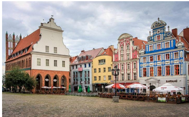
Rynek Sienny - ratusz