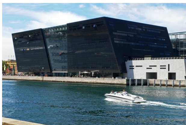
Czarny Diament – Biblioteka Królewska

Biblioteka Królewska , której mury strzegą rękopisów Karen Blixen, Hansa Christiana Andersena oraz Sorena Kirkegaarda. Końcem XX wieku do zabytkowej części dobudowano konstrukcję z czarnego granitu i przyciemnianego szkła nazwaną Czarnym Diamentem. Obecnie budynek staje się jednym z symboli stolicy Danii. Zobaczmy z autokaru.