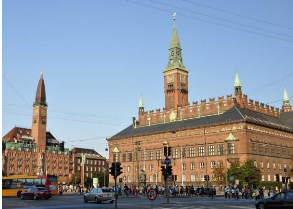
Plac Ratuszowy z ratuszem

Fontanny Gefion są najpiękniejszymi fontannami w stolicy Danii. Jest to zespół kaskadowych fontann z pięknymi rzeźbami, ilustrującymi fragment germańskiego mitu o powstaniu Zelandii, największej duńskiej wyspy, na której położona jest Kopenhaga. Sporej wielkości rzeźby przedstawiają boginię Gefion, która przemieniła swoich synów w woły, zaprzęgała je do pług i w ciągu nocy zorała nimi znaczną część terytorium Szwecji. Woda, która wdarła się w zoraone bruzdy oddzieliła tę część ziemi od półwyspu Skandynawskiego i w ten sposób powstała wyspa Zelandia, na której zlokalizowana jest Kopenhaga.