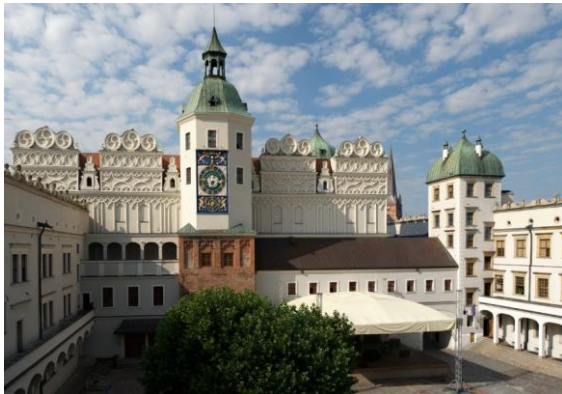
Zamek książąt pomorskich

Dawna siedziba książąt pomorskich z dynastii Gryfitów czyli szczeciński zamek została zbudowana w miejscu gdzie, we wczesnym średniowieczu, stał ufortyfikowany słowiański gród. Dzisiejszy zamek jest rekonstrukcją powojenną pozbawioną niestety wielu historycznych elementów. W zamku znajdują się obecnie instytucje kulturalne – teatr, kino, opera. Poznamy historię tego miejsca i zwiedzimy dziedzińce – zobaczymy pomnik księcia Bogusława i Anny Jagiellonki, dziedzińiec duży ( zegar zamkowy, płyta erekcyjna ks. Barnima, zegary słoneczne), dziedzińiec menniczny (figura bpa Ottona z Bambergu, płyta erekcyjna książąt Filipa i Franciszka, obrys kościoła św. Ottona).