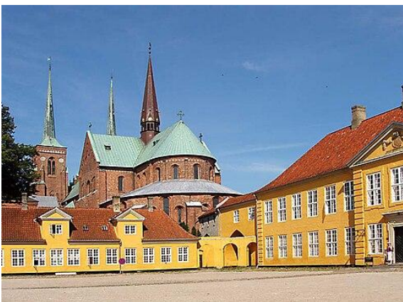
Dawny pałac Królewski , w tle katedra

Budynek ratusza architektonicznie dostosowany jest do stylu wieży. Jako miasto o królewskich tradycjach Roskilde posiada własny Pałac Królewski, znajdujący się obok katedry. Powstał w 1733 r. i dawniej służył jako rezydencja królewska podczas wizyt duńskiej rodziny królewskiej w Roskilde, później jako pałac biskupi. W pałacu obecnie mieszczą się różne muzea m.in. Muzeum Sztuki Współczesnej.