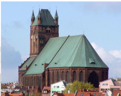
Bazylika archikatedralna św. Jakuba