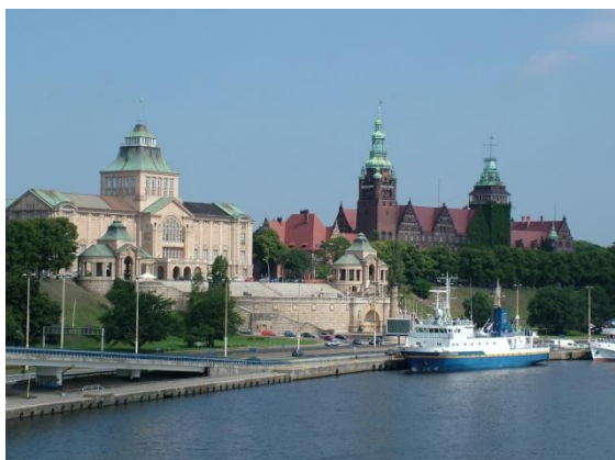
Widok na Wały Chrobrego

symfoniczna, sala kameralna, sale prób, sklep muzyczny, kawiarnia, obszerne foyer oraz garderoby dla artystów, magazyn instrumentów i biura.