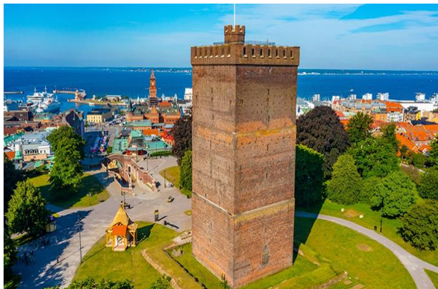
Wieża zwana Kärnan

Dzisiaj przedostanie się na drugą stronę cieśniny to pestka – co 20 minut z portu w Helsingborgu wypływają promy w kierunku Helsingør. My również przepłyniemy takim promem na teren Danii.