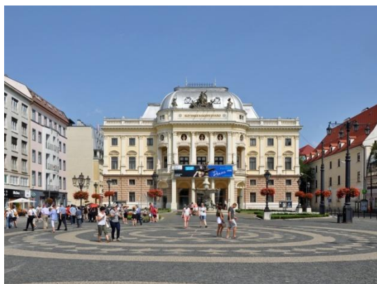
Hviezdoslavovo Namestie i Słowacki Teatr Narodowy

Hviezdoslavovo namestie zaliczany jest do najważniejszych placów w Bratysławie. Znajduje się między Nowym Mostem, a Teatrem Narodowym. Obsadzony jest drzewami i krzewami. Znajdują się tu także dwie fontanny oraz pomnik Pawła Orszagha Hviezdoslava. Plac jest miejscem odbywania się różnych wydarzeń kulturalnych i państwowych. Ma bardzo długą historię. Wytyczono go już w średniowieczu. Znajdowały się tu domy najważniejszych bratysławskich rodzin kupieckich. W 1848 roku z balkonu stojącego tu hotelu Zoldfa, ogłoszono „Odrodzenie Węgier”. W późniejszym czasie w hotelu tym zatrzymywali się między innymi cesarz Franciszek Józef czy Albert Einstein. W końcu XX wieku plac został gruntownie przebudowany. Dziś jest miejską promenadą z drzewami, ławkami oraz podestem przeznaczonym do występów i przemówień. Odbywają się tu między innymi jarmarki bożonarodzeniowe, koncerty czy miejskie imprezy.