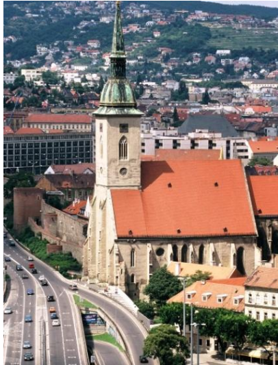
Katedra św. Marcina

Katedra świętego Marcina (Dom sv. Martina) to dawny kościół koronacyjny jedenastu królów węgierskich i ośmiu królowych – świadczy o tym 300 kilogramowa replika korony św. Stefana umieszczona na czubku wieży. W 1834 r w katedrze zaprezentowano Requiem Mozarta a w rok później Missa Solemnis Beethovena. W 1884 Franciszek Liszt wykonał tu słynną Mszę koronacyjną. We wnętrzu znajdują się fascynujące dzieła sztuki, takie jak XV-wieczny ołtarz wykonany przez Mistrza Pawła z Lewoczy, liczne rzeźby, a także imponujące organy – jedne z największych na Słowacji.