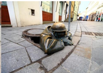
Čumil - Kanalarz

Pałac Prymasowski – najpiękniejszy pałac w Bratysławie zbudowany w XVIII w. dla prymasa Węgier i arcybiskupa Esztergom Josefa Batthyanyego. Wnętrza pałacu, stanowiące obecnie siedzibę prezydenta miasta są częściowo udostępniane dla zwiedzających. Najokazalsza jest Sala Zwierciadlana w której w 1805 roku podpisany został pokój z Napoleonem po jego zwycięstwie pod Sławkowem. Chlubą tego pałacu jest sześć pięknych unikatowych, angielskich gobelinów z 1632 roku przedstawiających starożytną legendę „Bohater i Leandros”.