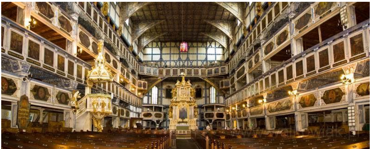
Kościół Pokoju w Jaworze

- Kościół Pokoju – ewangelicka, szachulcowa świątynia z XVII wieku, wpisana w 2001 r wraz z kościołem Pokoju w Świdnicy na listę Światowego Dziedzictwa UNESCO