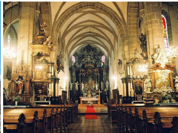
Wnętrze kościoła św. Marcina