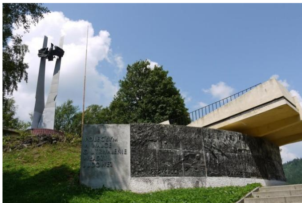
Pomnik milicjantów w Cisnej

przez bandy UPA. Utworzono posterunek milicji. Jednakże został on wysadzony w powietrze wraz z 6 milicjantami pełniącymi służbę. Spokój nastał dopiero w 1947 roku po likwidacji band UPA i przeprowadzonej operacji Wisła. Na wzgórzu stanął pomnik poświęcony pamięci obrońców Cisnej i mieszkańców którzy tu walczyli i polegli. W latach 80-tych pomnik zastąpiono obecnym bardziej okazałym.