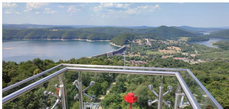
Wieża widokowa i widok z platformy-tarasu na wieży

Trasa przejazdu koleją gondolową ma długość 1,5 km. W trakcie przejazdu można podziwiać panoramę Bieszczad, w tym Jezioro Solińskie i zalew Myczkowski. Kolejka wjeżdża na górę Jawor. Przejazd 8 osobowymi gondolami w jedną stronę trwa ok. 8 minut. Równie piękne widoki można podziwiać z nowej wieży widokowej przy górnej stacji kolejki na górze Jawor. Windą wjedziemy na taras widokowy na wysokość 10 piętra i będziemy podziwiać piękne panoramy.