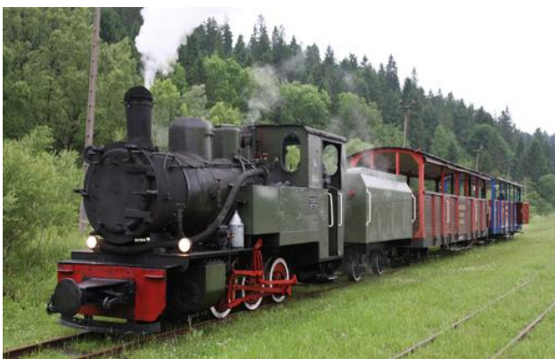
Bieszczadzka Kolejka Leśna