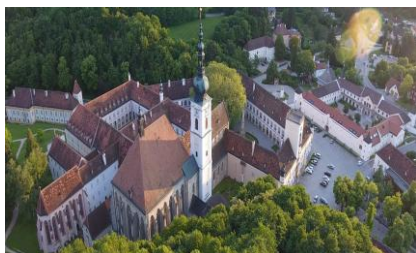
Opactwo z lotu ptaka

Klasztor istnieje nieprzerwanie od momentu założenia w 1133 roku, co czyni go drugim najstarszym klasztorem cystersów na świecie. Na terenie klasztoru przechowywane są relikwie Świętego Krzyża przywiezione z Jerozolimy.