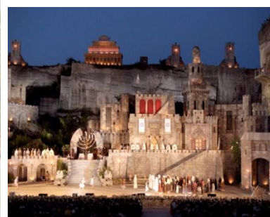
St. Margarethen –dawny kamieniołom rzymski, scena wielu oper światowych