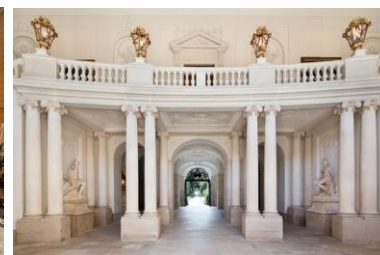
Sień wjazdowa na dziedziniec