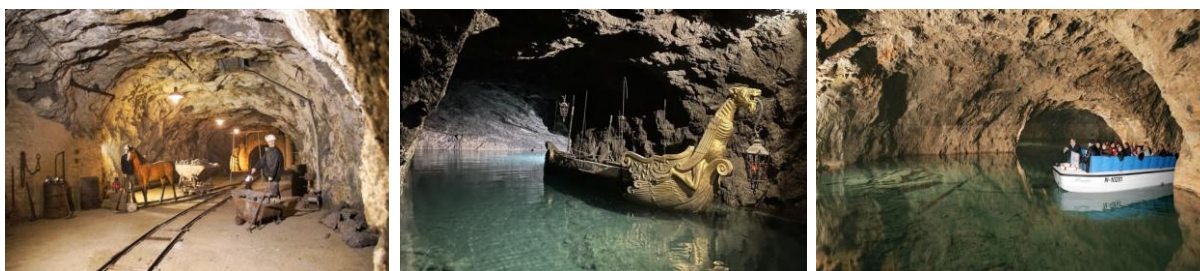
Chodniki dawnej kopalni kredy Jezioro Smocza łódź – rekwizyt filmowy Spacerowa łódka

Seegrotte – to największe podziemne jezioro w Europie które powstało w dawnej kopalni kredy a więc jest częściowo wynikiem działalności człowieka. Złóża gipsu wydobywano tu od XVIII wieku. Jednak w 1912 r. kopalnia została zalana przez wodę na skutek nieudanej eksplozji czyniąc ją niezdatną do użytku. Przez lata kopalnia stała w miejscu, aż kupił ją wiedeński przedsiębiorca.