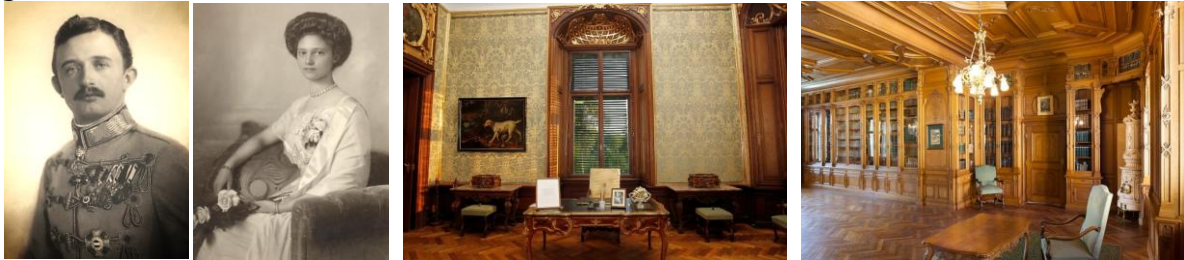
Karol I Habsburg i Zyta Burbon-Parmeńska // Pomieszczenia pałacowe

zrzeczenia się korony lub opuszczenia kraju przez Karola, w przeciwnym razie groził internowaniem.