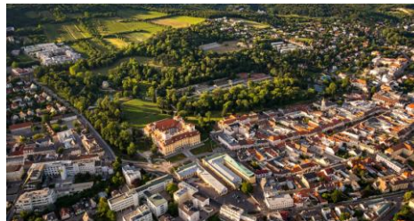
Eisenstadt z lotu ptaka