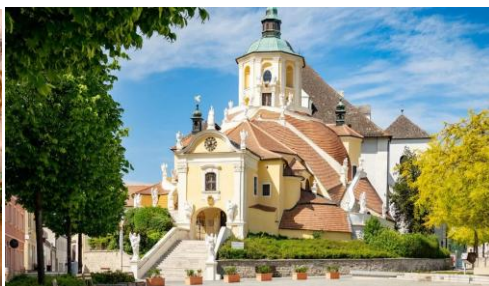
Bergkirche – mauzoleum Josefa Haydna