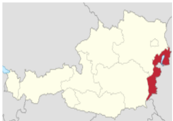
Burgenland na mapie Austrii

tu łagodny, a ziemia żyzna. Burgenland jest więc spichlerzem Austrii. Przede wszystkim jest to kraina winnej latorośli. Tu produkuje się 30 % austriackiego wina, które na rynkach światowych zyskuje coraz większe uznanie. Przez całe wieki, toczył się spór o Burgenland pomiędzy Austrią i Węgrami. Po I Wojnie Światowej w 1921 r. ostatecznie przyłączono te tereny do Austrii. Jedną trzecią krainy stanowią lasy, najwyższym szczytem jest Geschriebenstein (884 m.n.p.m). Jedna piąta prowincji należy do rodziny Esterhazy – jednego z najbogatszych rodów w Austrii.