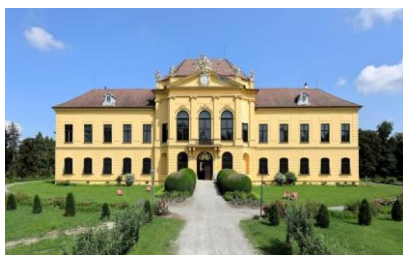
Pałac Eckarstau od frontu

Jesienią 11 listopada 1918 roku w dniu zrzeczenia się udziału w rządach cesarz Karol I Habsburg wraz z małżonką, cesarzową Zytą, opuścił w konwoju siedmiu samochodów dotychczasową rezydencję – pałac Schönbrunn – oraz niespokojną stolicę i w nocy pojawił się w Eckarstau, gdzie dołączyły potem dzieci. Powodem było przejęcie przez nowe republikańskie władze Schönbrunnu i innych oficjalnych rezydencji, tymczasem tutejszy pałac myśliwski należał do prywatnego majątku Habsburgów i, na razie, pozostawał ich własnością.