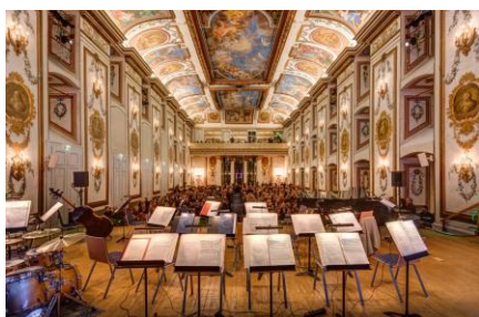
Sala Haydna w zamku Esterhazy