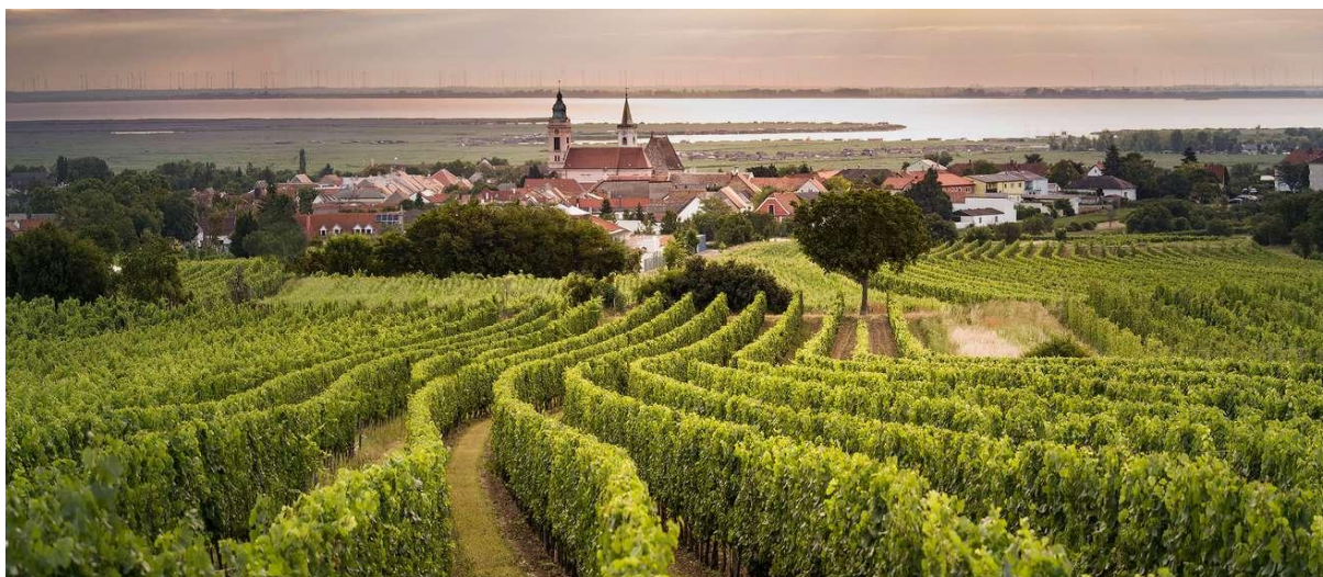
Panorama miasteczka Rust, w tle Jezioro Nezyderskie

W drugiej połowie XV wieku Rust otrzymało liczne przywileje handlowe, a w 1479 roku założony został tu cech winiarzy. Już w 1524 r. cesarz zezwolił winiarzom na znakowanie beczek literą R, a korki butelek do dzisiaj noszą to znakowanie. Miasto zostało całkowicie zniszczone podczas najazdu tureckiego w XVI w. Niedługo potem odbudowane, przetrwało w prawie nie zmienionym stanie do obecnych czasów. W 1649 roku mieszkańcy Rust za przeszło 60 tysięcy florenów i 500 wiader miejscowego wina wykupili swoje miasto od rodziny Esterházy, a niespełna 30 lat później cesarz Leopold I Habsburg nadał mu status wolnego miasta królewskiego.