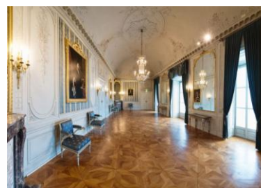
Zamek rody Esterhazy w Eisenstadt i wnętrza