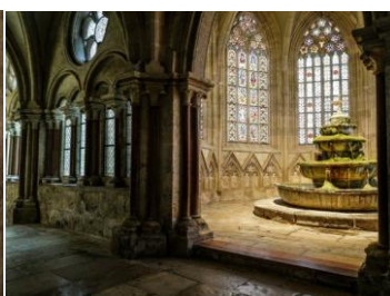
Fontanna w krużgankach