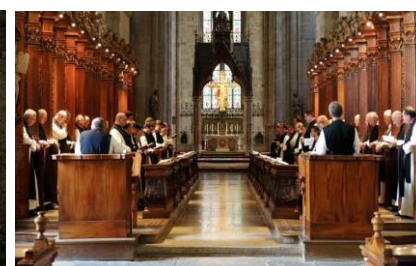
Cystersi w kościele klasztornym

Na terenie klasztoru żyje około 70 zakonników, którzy pracują duszpastersko w pobliskich parafiach. Klasztor Heiligenkreuz (obok Opactwa Rein) jest jednym z nielicznych tego typu obiektów w Europie w którym od początku swego istnienia do czasów obecnych nieprzerwanie mieszkają Cystersi. Podczas wycieczki z przewodnikiem zobaczymy średniowieczny klasztor i miejsce pochówku Babenbergów. Ta dynastia jest najstarszą dynastią rządzącą w Austrii i przez wieki kształtowała historię kraju. Zwiedzając obiekt, dowiemy się jak żyli mnisi w dawnych czasach i obecnie, czym się zajmowali i jaką rolę odgrywali w państwie. To tutejsi bracia nagrali CD z Chórami Gregoriańskimi. Ich płyta wspięła się na szczyty światowych list przebojów.